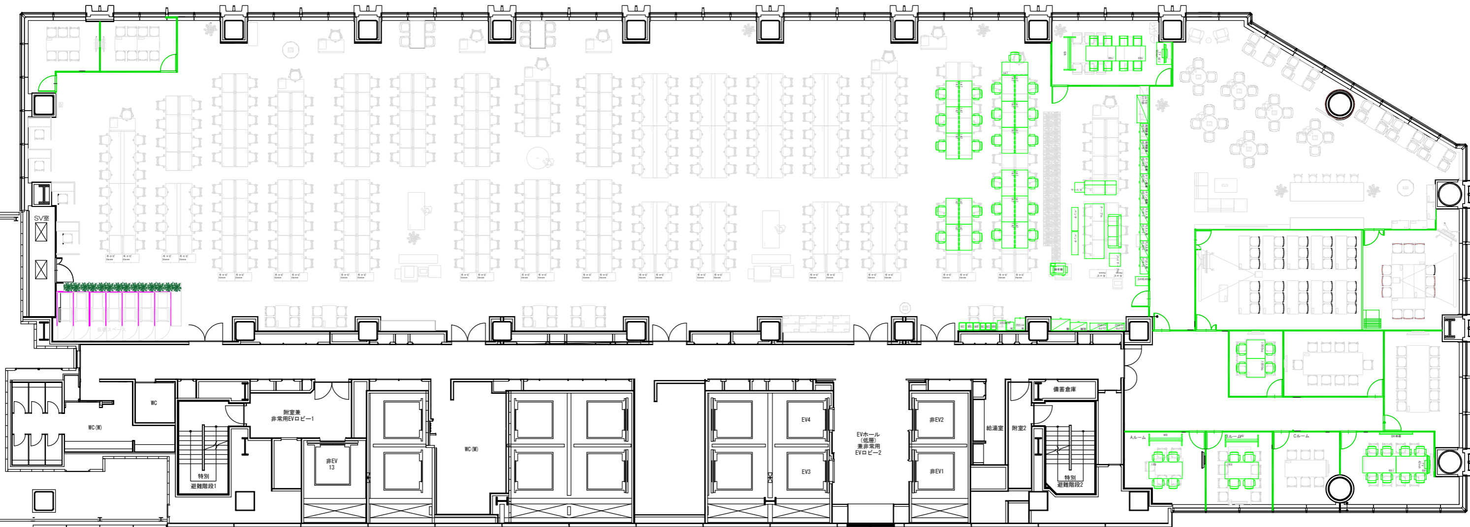
■移転元 新宿国際ビルディング 503号室